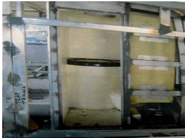
Proses Pemasangan Toilet

Setelah selesai penyemprotan cairan PU selanjutnya pemasangan Toilet yang terletak pada bus di bagian dalam belakang sebelah kiri, bahan yang di gunakan untuk toilet adalah fiberglass yang dilapisi pipa supaya kuat. Bagian luar toilet pada bus ini disemprot menggunakan pu dengan tujuan sebagai peredam suara, panas, dan mencegah korosi pada bagian yang dilindunginya