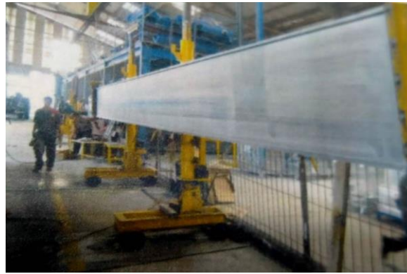
Proses Pemasangan Plat Lambung Pada jig