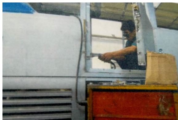
Proses Pemasangan Pintu Darurat

Proses Pemasangan Pintu darurat terletak di bagian kanan kendaraan, Pintu ini digunakan hanya ketika keadaan darurat, sehingga handle pintu didesain dengan penutup. Pintu sopir menurut peraturan pemerintah tidak boleh lagi digunakan, tetapi pada beberapa kendaraan masih dilengkapi Pintu darurat dipasang menggunakan engsel dilas serta dilengkapi dengan mur-mur baut agar mudah dilepas, adanya Pintu depan kiri dan pintu belakang merupakan pintu bus yang digunakan sebagai pintu keluar masuknya penumpang.