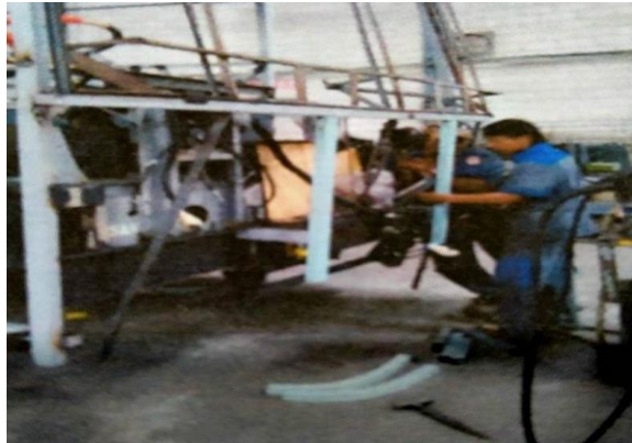
Pemasangan Cowl Depan, Belakang

Proses yang terdapat pada station 4 yaitu pemasangan cowl depan, belakang, panel atap. Pekerjaan yang terdapat pada proses pemasangan cowl depan meliputi pemasangan dudukan kaca, pemasangan frame cowl depan bagian bawah, pemasangan frame cowl belakang.