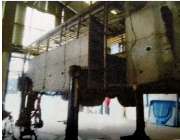
Proses Tahap Akhir Pembuatan Body Rangka pada Bus