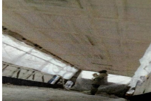
Proses Penyemprotan PU pada bus

Setelah Semua Proses Pemasangan Selesai Selanjutnya Proses Penyemprotan Cairan PU. Cairan PU adalah suatu cairan kimia yang disemprotkan pada bagian dalam kendaraan, Sebagai pencegahan utama agar tidak terjadinya korosi pada bagian tertentu dan Cairan PU Berfungsi sebagai peredam suara, panas dan Kebocoran.