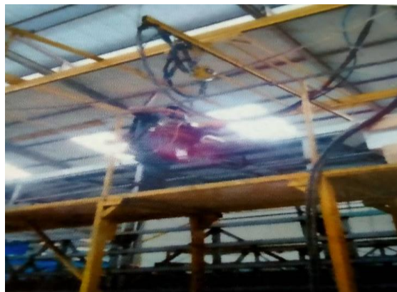
Proses Pengelasan Pen

Pengelasan Pen yaitu penyambungan pengelasan memakai metod resistansi listrik dimana plat lembaran dijepit dengan dua elektroda. Ketika arus dialirkan maka terjadi sambungan las pada posisi jepitan. Siklus pengelasan titik dimulai ketika elektroda menekan plat dimana arus belum dialirkan (Waktu proses ini disebut waktu tekan). Setelah itu arus dialirkan ke elektroda sehingga timbul panas pada plat di posisi elektroda sehingga terbentuk sambungan las (Waktu proses ini disebut waktu las). Setelah itu arus dihentikan namun tekanan tetap ada dan proses ini disebut (waktu tenggang). Kemudian logam dibiarkan dingin sampai sambungan menjadi kuat dan tekanan pada plat dihilangkan dan plat siap dipindahkan untuk selanjutnya proses pengelasan.