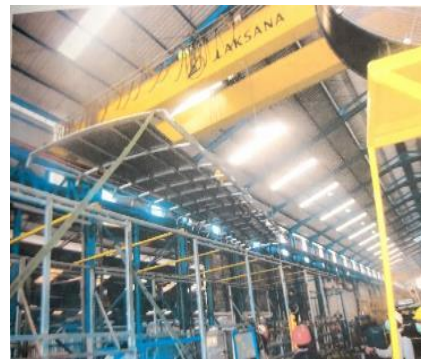
Pemasangan Rangka Kanan , Kiri Dan Rangka Atap