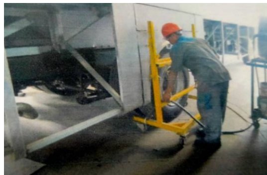
Pemasangan Lambung Bawah

Lambung bawah adalah bagian dari kendaraan bus yang terletak disamping kanan dan kiri dekat dengan roda. Pemasangan lambung bawah dilakukan dengan pengelasan antara rangka lambung bawah dengan slide frame, begitu juga dengan pemasangan tutup ending bawah bagian depan.