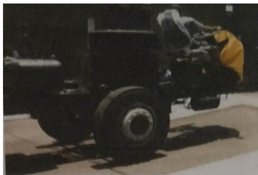
Gambar 1. Proses Preparation

Proses Preparation ini merupakan proses penting dari sebuah pembuatan body bus , dimana ketika chassis bus datang dari pemesan maka chassis wajib diberlakukan khusus sebelum masuk ke sebuah “ line process ”, karena dalam proses pembuatan body bus akan banyak proses pengelasan maka beberapa komponen bawaan chassis wajib dilepas untuk menghindari kontak, terbakar, atau rusak karena proses tersebut, biasanya yang wajib dilepas adalah battery (accu) , tangka BBM, stir kemudi, dan beberapa komponen elektrik lainnya. sebelum masuk ke proses selanjutnya perlu dipersiapkan peralatan untuk melindungi komponen-komponen yang tidak lepas dari chassis contohnya roda, engine (mesin), dan lain-lain. Melindunginya cukup ditutup dengan kain anti panas untuk menghindari percikan api dari mesin las yang dapat melukai bahan karet dan plastik.