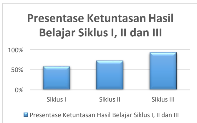
Tabel 4.8 Persentase Ketuntasan Hasil Belajar Siklus I,II dan III