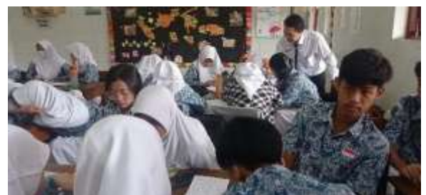
Gambar 4. Pembelajaran model PBL di pertemuan 1 siklus II dengan materi

Tindakan pada siklus II dilaksanakan dalam empat kali pertemuan (tiga pertemuan pembelajaran dan 1 pertemuan tes siklus II) dengan rincian yaitu: pertemuan pertama dilaksanakan hari kamis tanggal 11 Mei 2023; pertemuan kedua hari Senin tanggal 15 Mei 2023; pertemuan ketiga hari senin tanggal 22 Mei 2023; dan pertemuan keempat hari kamis 25 Mei 2023. Deskripsi pelaksanaan Siklus II sebagai berikut: