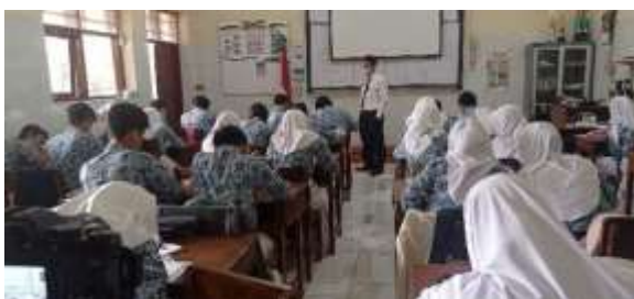
Gambar 7. Pemberian Tes Siklus II

Kegiatan tindakan pembelajaran siklus II terdiri dari dua pertemuan untuk menyampaikan materi, satu pertemuan untuk latihan soal dengan media kartu berpasangan dan satu pertemuan untuk melaksanakan tes akhir Siklus II. Materi yang disampaikan pada siklus II adalah mengkonstruksi persamaan fungsi kuadrat. Pembelajaran diawali dengan mengajak berdoa bersama dan mengecek kehadiran siswa, kemudian melakukan apersepsi berupa mengulang dan mengingat kembali materi pelajaran yang telah dibahas pada pertemuan sebelumnya, yaitu dengan membahas kesalahan-kesalahan pada quis pada pertemuan sebelumnya. Guru