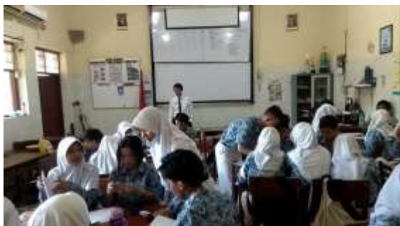
Gambar 2. Pembelajaran berbantuan media kartu berpasangan