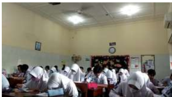
Gambar 3. Pemberian Tes Siklus I

Siklus I terdiri dari tiga pertemuan dengan rincian 2 pertemuan untuk pembelajaran model PBL dengan media kartu berpasangan dan 1 pertemuan untuk tes siklus I. Materi yang disampaikan pada siklus pertama adalah karakteristik fungsi kuadrat yang meliputi bentuk grafik, koordinat titik potong sumbu Y, banyaknya titik potong sumbu X, koordinat titik potong sumbu X dan koordinat titik puncak. Secara garis besar proses pembelajaran yang dilakukan pada tiap pertemuan mengikuti urutan langkah-langkah penerapan pembelajaran model