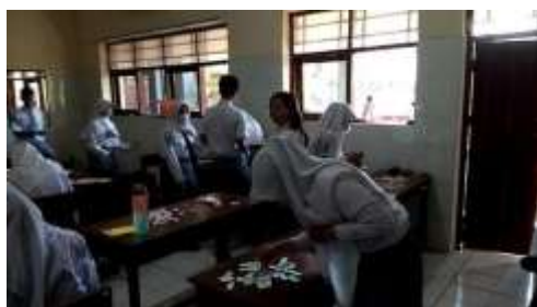
Gambar 6. Pembelajaran berbantuan media kartu berpasangan pada siklus II