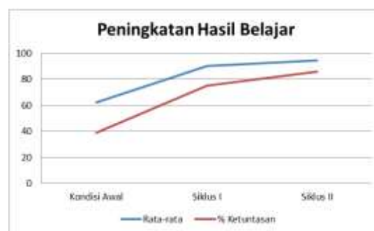
Gambar 8. Peningkatan rata-rata Hasil Belajar dan Ketuntasan Belajar

Keberhasilan ini tidak lepas dari usaha guru dalam melaksanakan pemebelajaran. Pemebelajaran menggunakan model Problem based learning sangat membantu dalam meningkatkan motivasi belajar siswa. Dengan meningkatnya motivasi belajar siswa, siswa akan lebih fokus dan memeiliki tujuan dalam belajar matematika. Hal ini sejalan dengan hasil penelitian (Arief & Sudin, 2016), bahwa model pemebelajaran Problem Based Learning dapat meningkatkan motivasi belajar siswa.