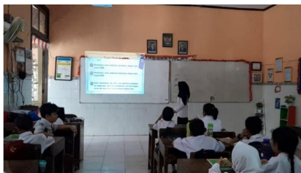
Gambar 2. Proses Pembelajaran Kelas IV SDN Bendungan

Tabel 1 di atas terlihat pada siklus 1 terjadi peningkatan hasil belajar siswa dari 27 siswa yang mengikuti evaluasi pembelajaran terdapat 22 siswa (81%) tuntas atau mampu mencapai KKM 70 dan 5 siswa tidak tuntas atau masih berada dibawah KKM. Nilai tertinggi yang dicapai siswa yaitu 100 dan nilai terendah 40 dengan nilai rata-rata kelas adalah 72. Kemudian disiklus 2 ada peningkatan hasil belajar siswa 27 siswa yang mengikuti evaluasi pembelajaran terdapat 24 siswa (94%) tuntas atau mampu mencapai KKM 70 dan 3 siswa (6%) tidak tuntas atau masih berada dibawah KKM. Nilai tertinggi yang diperoleh siswa yaitu 93 dan nilai terendah 43 dengan nilai rata-rata kelas adalah 77.