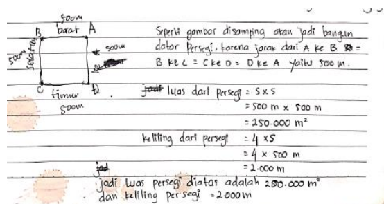
Gambar 2. Hasil Pekerjaan Subjek Kemampuan Tinggi TPM II

Berdasarkan hasil pekerjaan yang telah dilakukan oleh subjek berkemampuan matematika tinggi dalam menyelesaikan masalah matematika serta dilakukan wawancara sesuai dengan indikator pemahaman konsep maka diperoleh hasil sebagai berikut; pada tahapan translation subjek mampu memahami soal dengan baik sehingga subjek mampu mengungkapkan apa yang diketahui dan ditanyakan dari soal ke dalam bentuk model matematika. Pada tahapan interpretation subjek mampu menafsirkan informasi yang telah diperoleh sehingga dapat mengidentifikasi langkah selanjutnya sesuai dengan petunjuk yang dibuat serta mampu mengungkapkan alasan kenapa langkah tersebut dilakukan. Pada tahapan extrapolation subjek mampu melakukan perhitungan dengan benar serta dapat mengambil kesimpulan berdasarkan bahasa sendiri secara lisan sesuai dengan apa yang telah dikerjakan. Berikut merupakan gambaran umum berkaitan dengan hasil pemahaman konsep subjek kemampuan matematika tinggi dalam menyelesaikan masalah matematika yang dipaparkan dalam bentuk Tabel 1.