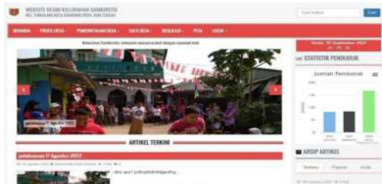
Gambar 1 Halaman Utama

Hasil dari implementasi pembuatan system informasi pelayanan permohonan surat berbasis website. Pada halaman utama website berisi artikel-artikel kegiatan yang terjadi di kelurahan, dan data-data mengenai kelurahan, mulai dari jumlah penduduk, nama perangkat kelurahan, lokasi administrasi dan lainnya. Untuk tampilannya seperti gambar 1 dibawah ini :