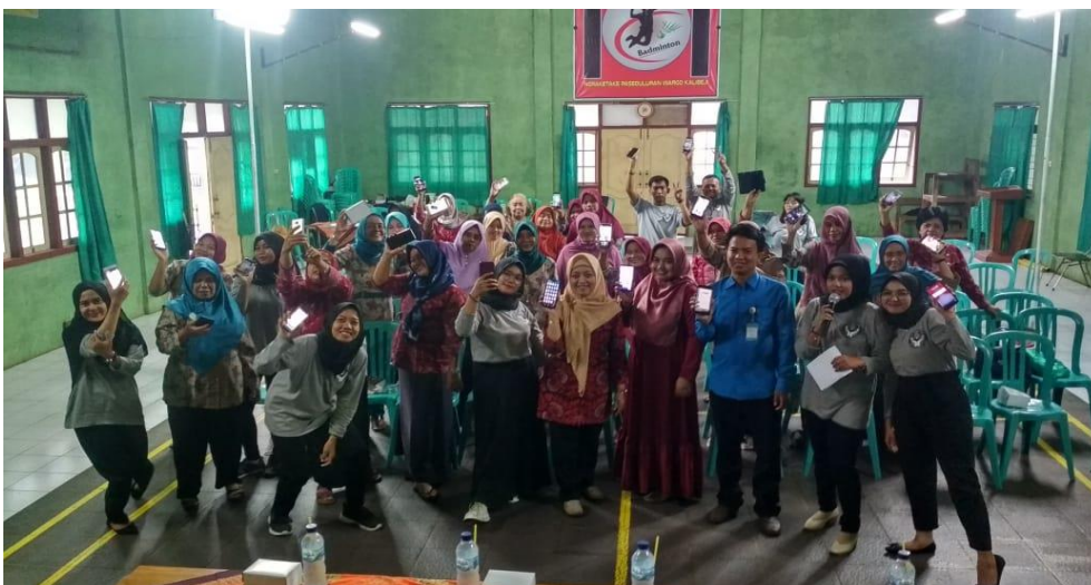
Gambar 4. Peserta Pelatihan dan Tim Pengabdi

Pengedukasian Youtube Kids bagi para orang tua menjadi penting mengingat saat ini anak-anak sudah sangat familier dengan gadget. Sesuai hasil penelitian Putra Asaas dan Diah Ayu Patmaningrum (2018) yang menyatakan bahwa pengaruh konten pada aplikasi Youtube terhadap komunikasi interpersonal anak TK di Kota Bandung berada pada kategori baik. Oleh karena itu orang tua mengawasi dan membatasi penggunaan martphone yang