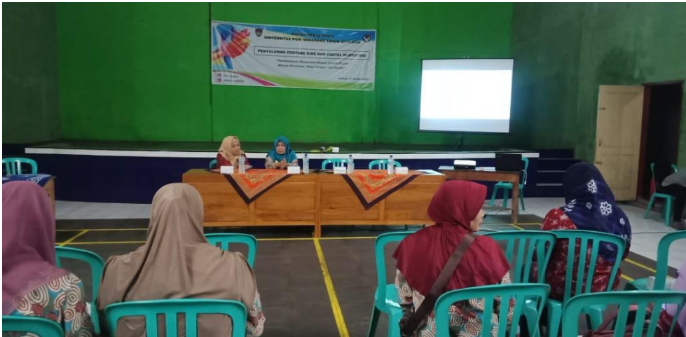
Gambar 3. Penyampaian Materi Aplikasi Youtube Kid oleh Tim Pengabdi