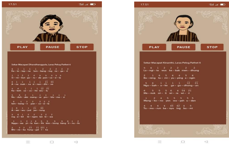
Foto 2 isi pada menu tembang macapat