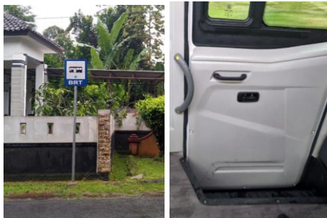
Gambar 2 Tidak adanya shelter yang memadai dan tidak adanya ramp pada feeder

Penilaian para pengguna layanan feeder dan Trans Semarang terhadap fasilitas difabel halte dan kendaraan feeder dalam membantu aktivitasnya menunjukkan angka 56%. Angka persentase ini menunjukkan bahwa fasilitas difabel halte dan kendaraan feeder artinya belum cukup baik dalam membantu aktivitas pengguna sehingga masih perlu ditingkatkan. Rendahnya persentase tersebut dapat disebabkan oleh berbagai macam hal, beberapa diantaranya adalah kelengkapan fasilitas, baik fasilitas yang ada di terminal, shelter maupun yang ada pada feeder itu sendiri.