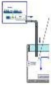
Gambar 3. Diagram proses Unit Mobile Ozonasi Katalitik (E-Sikat)

Perbandingan efisiensi proses penghilangan warna dengan input 2 liter air limbah industri kecap dapat diketahui melalui hasil pengujian air terolah yang ditunjukkan pada Tabel 1. Terlihat bahwa warna air limbah menunjukkan penurunan sebesar 55% setelah proses ozonasi saja selama 35 menit. Sedangkan waktu ozonasi katalitik batch untuk penghilangan warna air limbah sebesar 95% adalah 19 menit. Secara umum proses mobile ozonasi katalitik menunjukkan efisiensi penghilangan warna terbaik yaitu untuk penghilangan warna air limbah sebesar 95% adalah 11 menit.